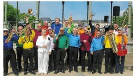
Le Layon Jazz Band sera en concert, samedi 20 juillet dans le parc des loisirs de Saint-Macaire-du-Bois.

Le spectacle « Les Frères Lampion » du Layon jazz-band se propose au Parc des loisirs, pendant le festival de jazz, il réunit également des interprétations plus classiques.